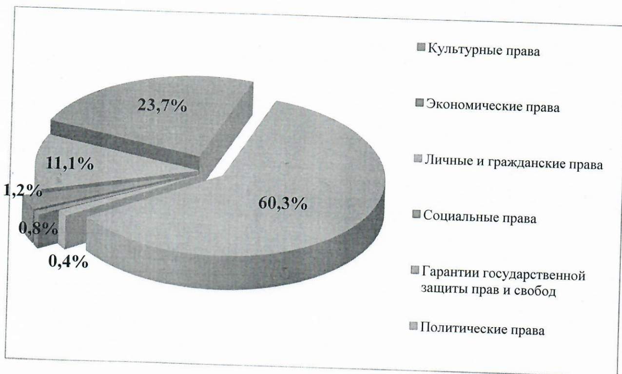
Распределение обращений по группам прав в 2021 году

гарантии прав человека в конституционном, гражданском, административном и уголовном производстве, деятельности правоохранительных и иных органов, в местах принудительного содержания – 298 (60,3%).