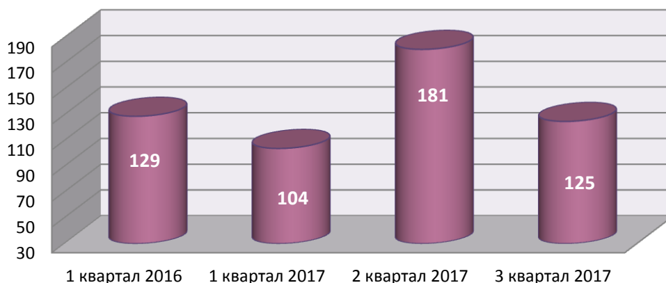
Поступление обращений граждан в ЗСО и депутатам ЗСО через электронные каналы связи в 1 квартале 2016 и 1, 2, 3 кварталах 2017 года

Среди поступивших в Законодательное Собрание области, постоянные комитеты, должностным лицам ЗСО обращений 86 % составили индивидуальные обращения, 14 % – коллективные.